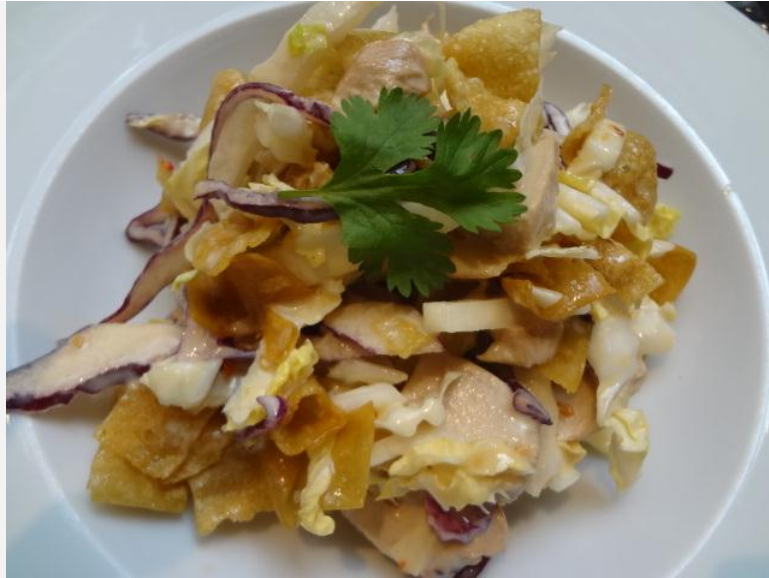
Salade croustillante de poulet