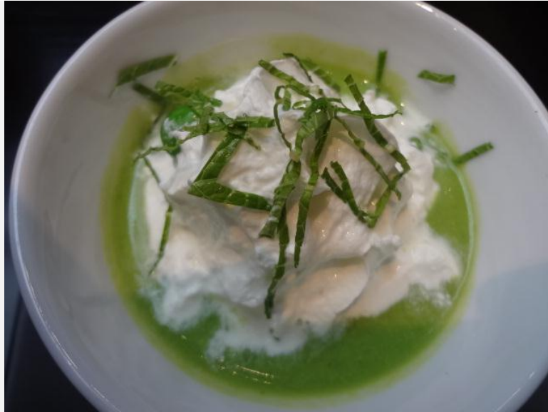
Crème glacée de petits pois