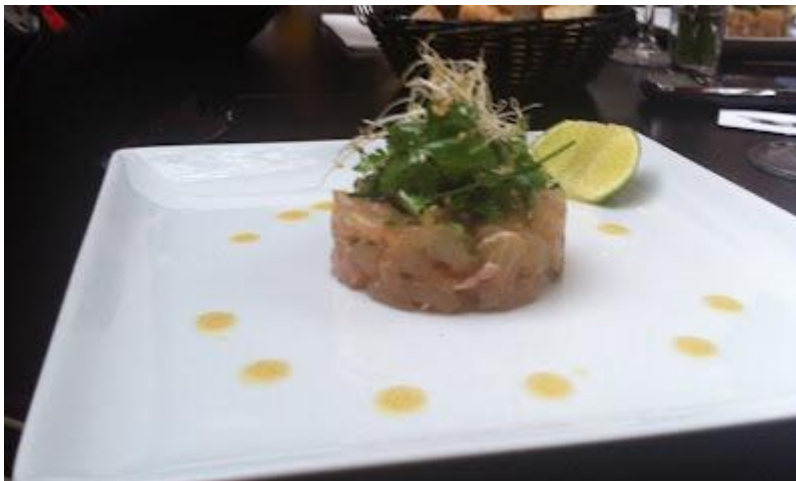
Une seule entrée a été prise: un tartare de daurade.

Il y a aussi une formule brunch le dimanche à 25e avec des choix de plats à la carte (plats correspondant pour la plupart à ceux que nous pouvons commander en formule déjeuner ou dîner).