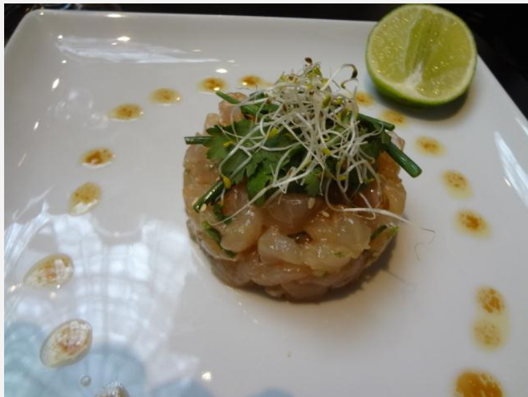
Tartare de dorade

En revanche, la salade croustillante de poulet, miel et sésame, avec sa vinaigrette bien assaisonnée fait une jolie surprise et, pour 9 €, presque un plat/repas complet. L'autre belle surprise: une carte des vins pleine d'à propos, avec de jolis crus dans tous les terroirs (bordeaux château Naudin-Larchay, crozes de Combier, joli beaujolais de Chermette « les griottes » à prix prix modeste). Bref, on trouvera là de tout pour tous.