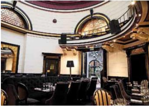
Le Dôme du Marais.