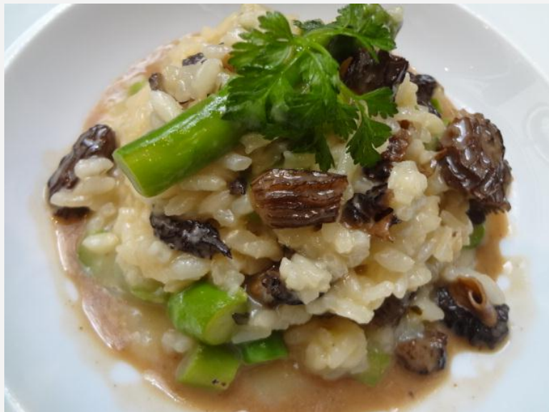
Risotto asperges et morilles

Le dimanche, on vient pour le brunch, tarifé avec modestie, avec oeufs brouillés, saumon ou bacon, plus viennoiseries. Mais la crème glacée de petits pois ou le tartare de daurade avec citron vert, gingembre et salade d'herbes font bon effet. On tiquera un peu le risotto d'asperges et morilles un peu trop salé, avec son riz (un brin surcuit) à la française, le tartare de boeuf bio au couteau façon « Loc Lac », avec sa sauce soja, façon chinoise et ses pommes de terre sous-cuites.