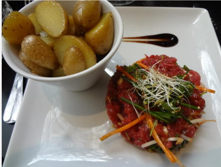
Tartare de boeuf façon Loc Lac

On allait oublier de louer le service charmeur, l'ambiance cosy et parisienne, les desserts bien vus (joli cheese cake, glaces et sorbet issus d'Ardèche de bonne composition). La maison, ouverte chaque jour, fait aussi salon de thé toute l'après midi.