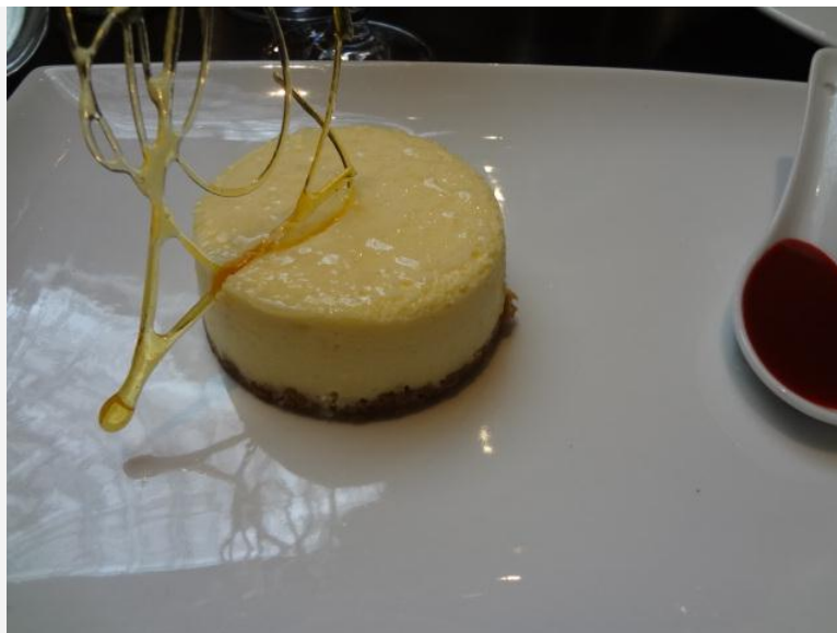
Cheese cake

On allait oublier de louer le service charmeur, l'ambiance cosy et parisienne, les desserts bien vus (joli cheese cake, glaces et sorbet issus d'Ardèche de bonne composition). La maison, ouverte chaque jour, fait aussi salon de thé toute l'après midi.