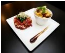
Steak tartare lok-lak at Le Dôme du Marais

Although the magnificent glass dome above the dining room may make it hard to believe, this restaurant in the Marais long ago was a pawnshop. Now, following a recent change in management, it's become a very good and very useful address for summer dining. Not only is it open seven days a week, but the seasonal menu is ideal for warm-weather dining. Start with sea bream tartare with lime and ginger or a delightful cold pea soup, and then tuck into main courses like grilled sole with potato purée or Thai-style beef with steamed rice. Desserts are terrific, including a cheesecake with a speculoos (Belgian spice cookie) crust and raspberry tart with champagne gelée.