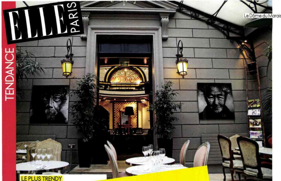
Le Dôme du Marais

ELLE | LE BOOM DES IT BRUNCH 06 avril 2012 par Elodie Rouge