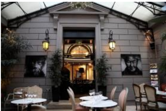
Le Dôme du Marais 53 bis, rue des Francs-Bourgeois

Pour finir, un petit chef d'œuvre de dessert dans une variation sur la clémentine tout en harmonie, en équilibre et en perfection des saveurs. Bien vu. Par contre, la Belle assiette de jambon Belotta est tranchée beaucoup trop fine (papier à cigarettes) donc pas de mâche et un goût évanescent. Le Filet de Saint-Pierre est un peu surcuit et la Raviole de homard bleu à l'écume de bourbon est noyée dans une sauce pour le moins envahissante qui rend le plat assez peu esthétique et pas appétissant. L'adresse est intéressante sur le plan du décor et de l'ambiance même si la cuisine se cherche encore et espérons pour peu de temps. Service diligent et motivé, carte des vins en devenir et bon choix de vins au verre. Affaire à suivre.